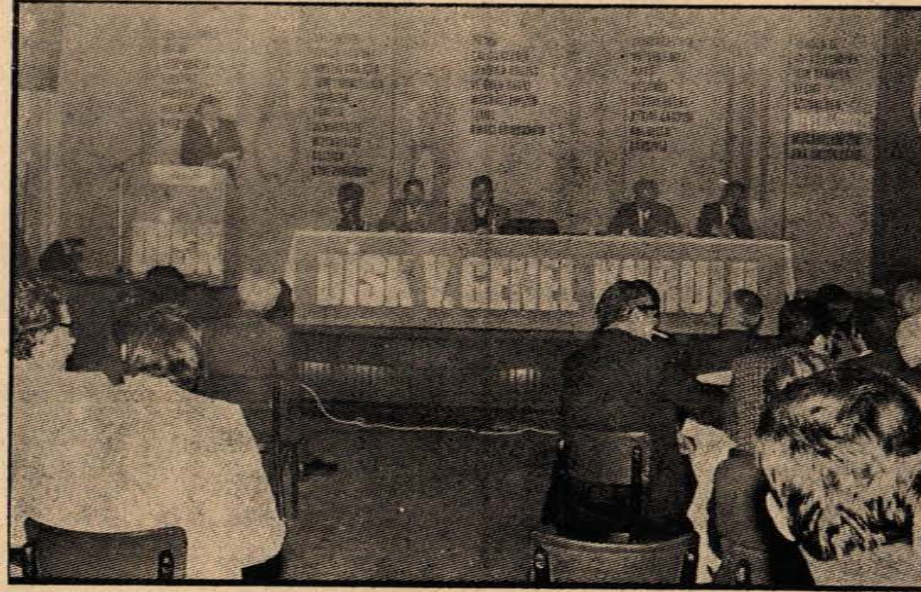
DİSK kongre açış konuşmasını yapan genel başkan Kemal Türkler

Sizlerin ülkenizde yürütmekte olduğunuz demokratik mücadeleyi yakından izliyoruz. Bugün sizin mücadelenizin uluslararası düzeyde yürütülmesi gereğine inanıyoruz.