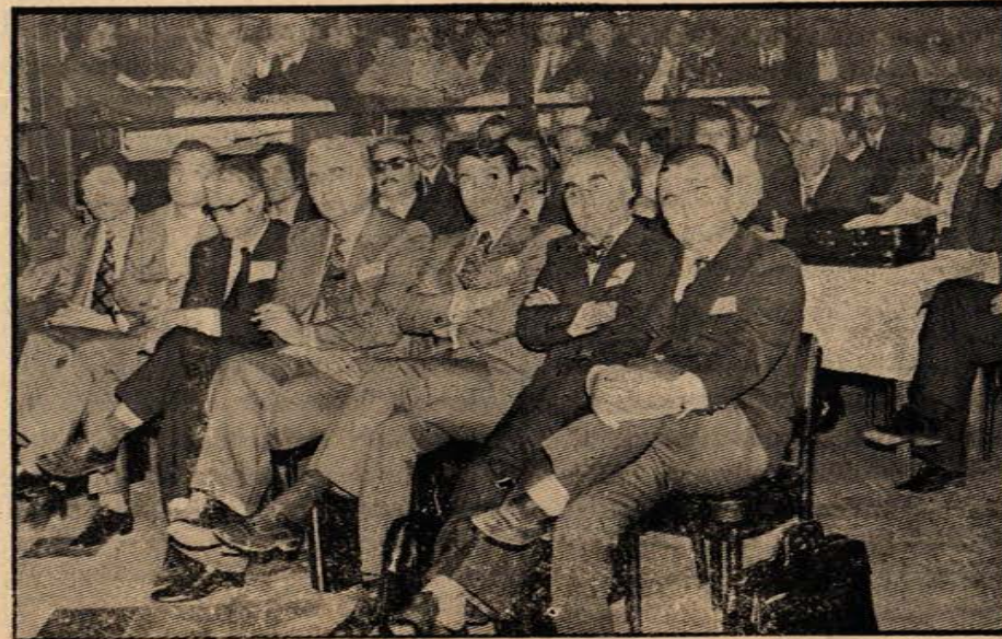
Sosyalist partilerin siyasi temsilcilerinin bulunmadığı DİSK kongresinde CHP'nin sağ kanadını temsil eden CHP li milletvekilleri.

Toplantının ikinci gününden itibaren gündem çalışmalarına geçilen kongrede tartışmalar, DİSK'in siyasi tutumunun ne olacağı meselesinde yoğunlaştı. Bilindiği gibi DİSK'i teşkil eden sendikalar içinde CHP, TİP ve TSİP yanlısı temsilciler bulunmaktadır. Ancak DİSK'e katılan yeni sendikaların çoğunlukla CHP'yi destekledikleri de bilinmektedir. Kongre çalışmaları sırasında alınan bir karara göre işçi sınıfının yanında mücadele veren partiler arasında sosyalizm doğrultusunda anti-faşist ve anti-emperyalist planda güçbirliği yapılması için mücadele verilmesi belirtilmiştir