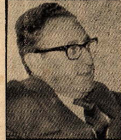
KİSSİNGER — Emperyalist politikanın tabikçisi.