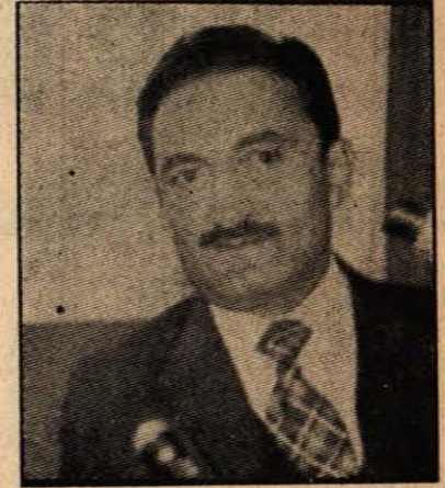
ECEVİT — Sol kol.