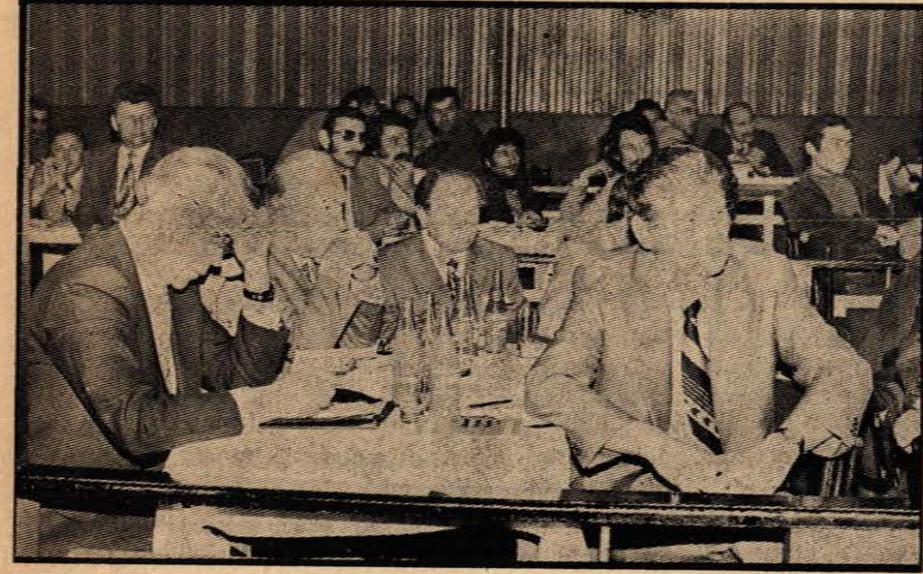
Kongreyi izleyen Sovyet, Bulgar, Polonya, Cezayir işçi temsilcileri

Eminiz ki, Sovyet ve Türk sendikaları arasında kardeşçe dostluk ve geniş kapsamlı işbirliği, ilerde de kuvetlenip gelişecektir.